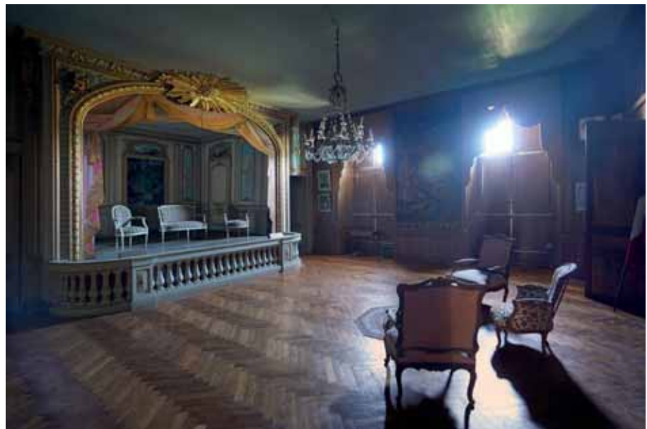
Azken funtzioa Última función