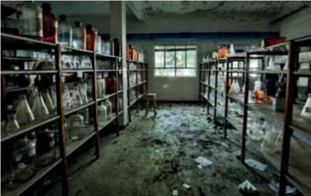
Laborategia El laboratorio