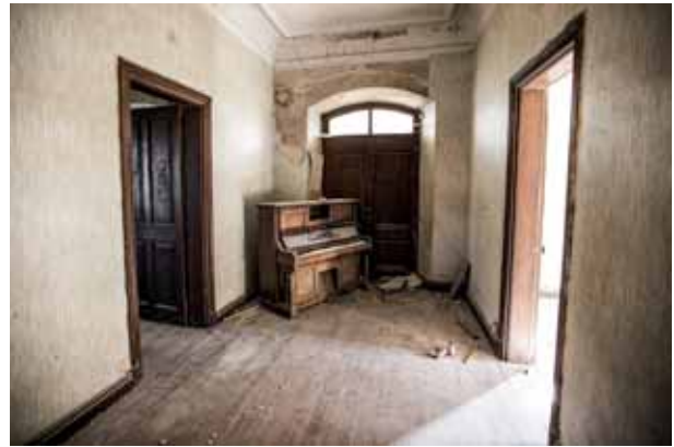
Indianoaren etxea La casa del indiano