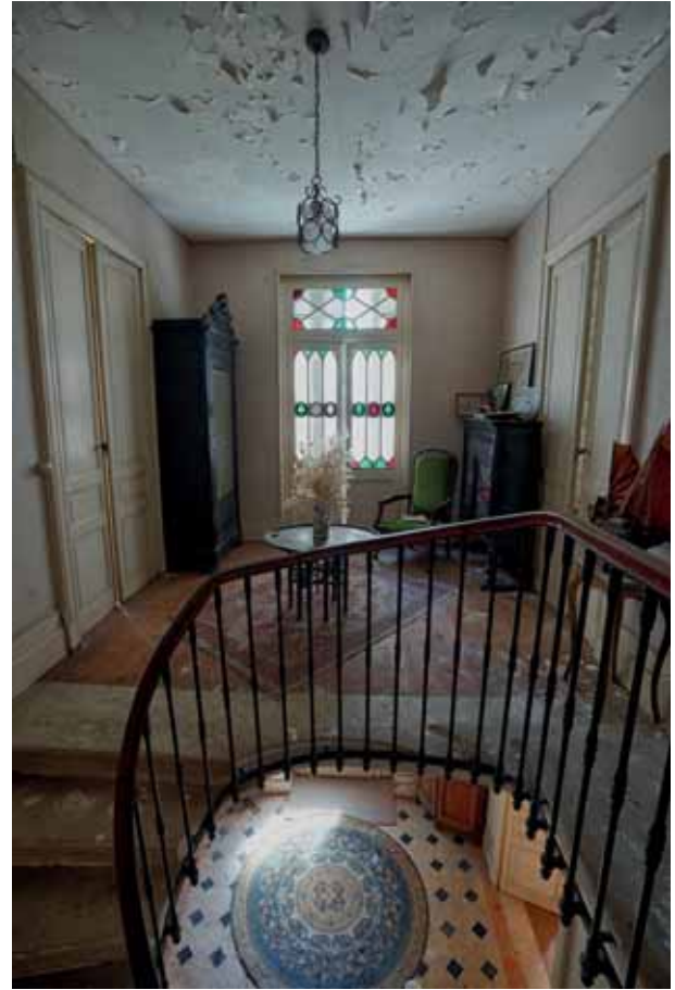
Irakurketaren txokoa El rincón de la lectura