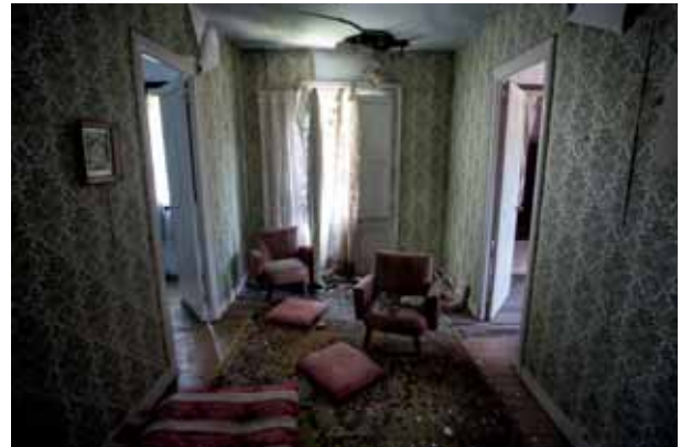
60ko hamarkadan gelditua Parado en los 60