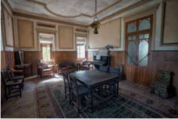
Mendixkako etxetzarra La casona de la colina