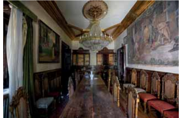
Azken oturuntza El último banquete