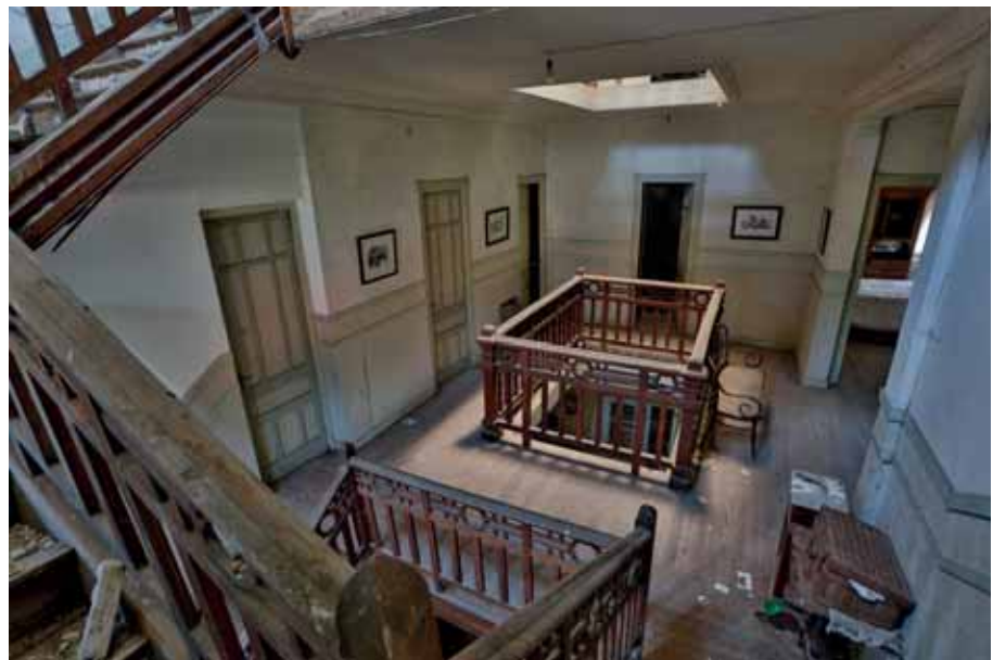
Medikuaren jauregia El palacio del doctor