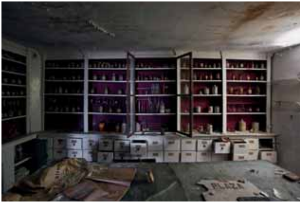
Botikarioaren etxea La casa del boticario