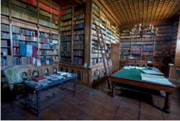
Bere istoriorik onena Su mejor historia