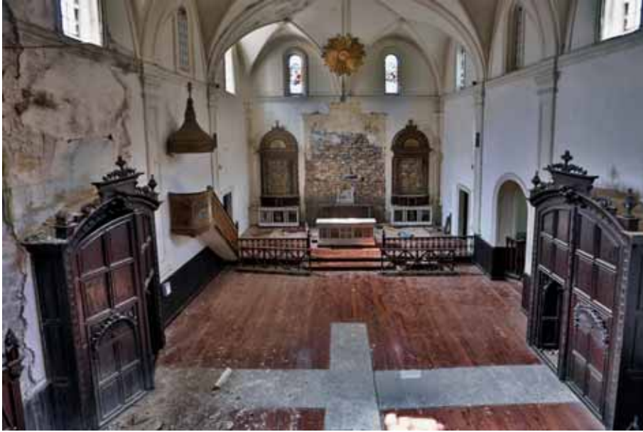
Tenplarioen parrokia La parroquia templaria