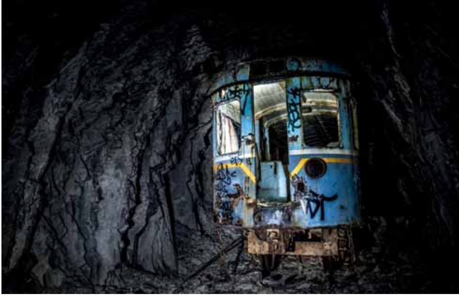
Helmugarik gabe Sin destino