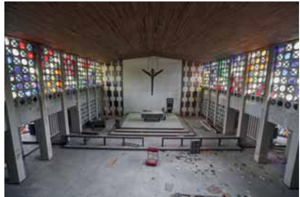
Jainkoak ahaztutakoak Los olvidados de Dios