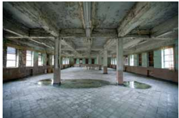
Hamaiketakoa El almuerzo