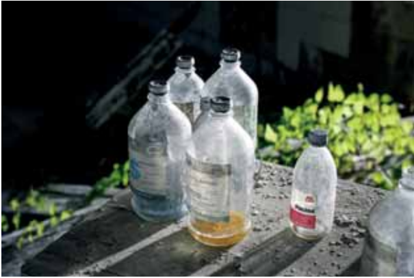
Beste garai bateko sendagaiak Medicamentos de otra época