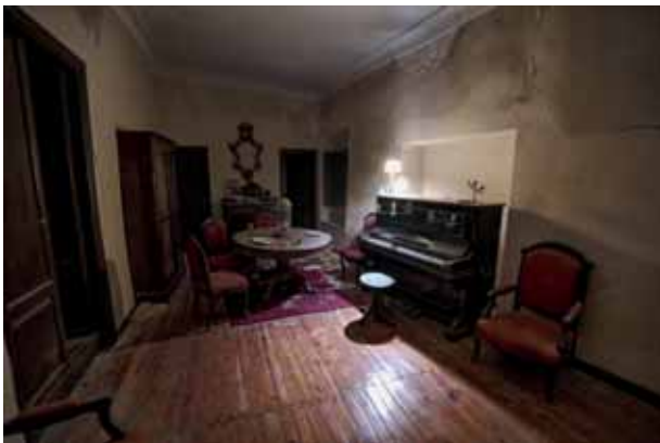
Burgesaren etxetzarra La casona del burgués