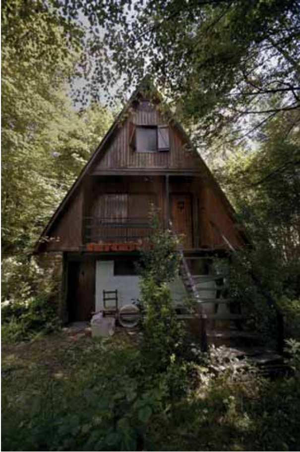
Babeslekua El refugio