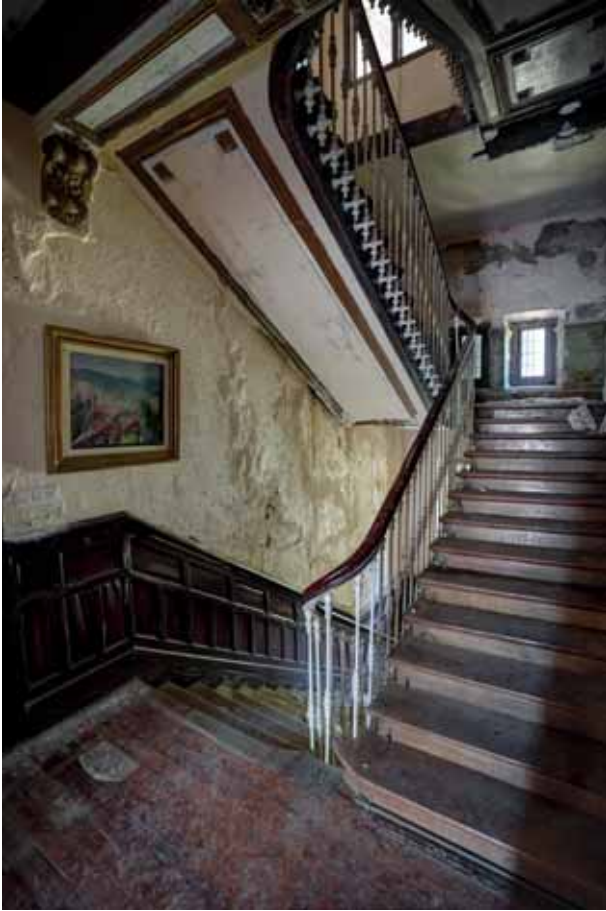
Zerurako eskailerak Escaleras al cielo