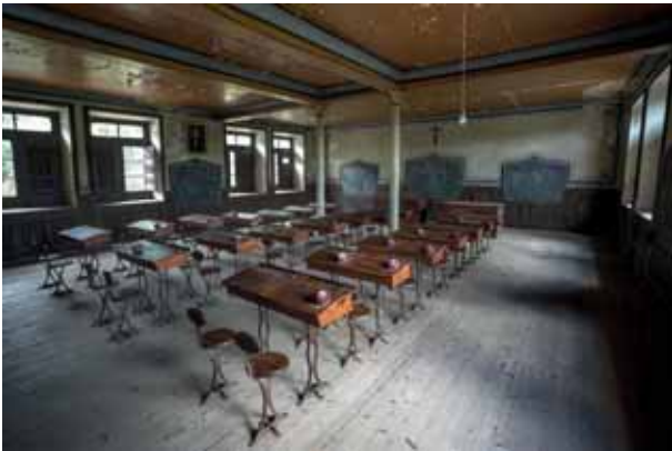
Sionesko eskola Escuela de Siones