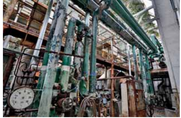
Tutuen mundua Mundo tubular