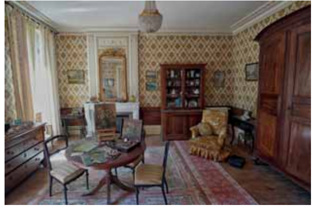
Margolariaren etxea La casa de la pintora