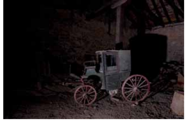
Gogoratzeko ibilaldia Un paseo para recordar